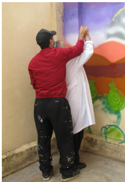
Mural dibujado en el Centro de Rehabilitación Psicosocial en colaboración con un artista de arte urbano de la Comarca de las Cinco Villas durante las jornadas del día mundial de la Salud Mental 2020